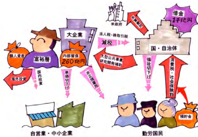
日本共産党が提案する新たな経済政策