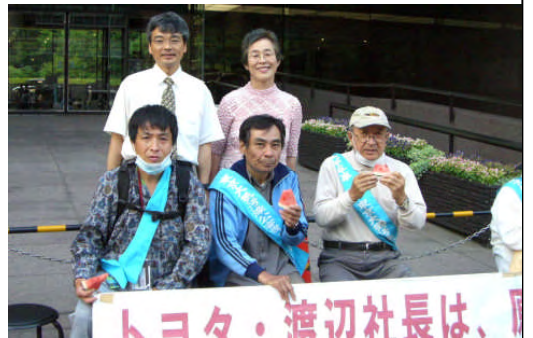
08年八巻区議集いに参加した西団長(左)